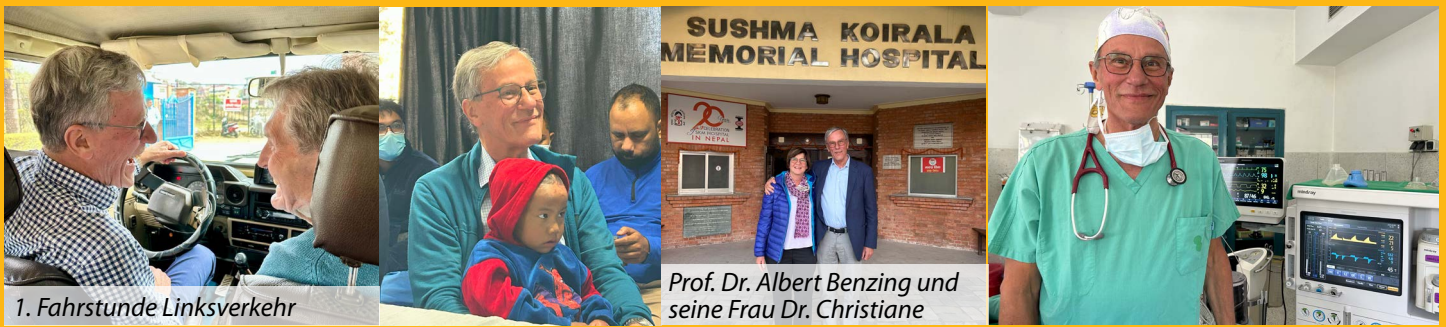
1. Fahrstunde Linksverkehr